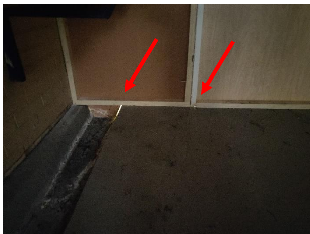
Kuva 1. Letkujen pesukäytävän väliseinässä epätiiveyttä.

Letkujen pesukäytävän PK025 sekä porrashuoneen PK001 välille rakennettujen osastovien väliseinärakenteiden/väliovien kohdalla mitattiin hetkellisesti paine-eroa käytöstä poistettuihin tiloihin nähden. Mittauksissa todettiin käytössä olevien tilojen olevan 0,1...1,2 Pa ylipaineisia käytöstä poistettuihin tiloihin nähden, jonka perusteella käytöstä poistetuista tiloista ei ainakaan mittaushetkellä ilmavirtausten mukana kulkeudu epäpuhtauksia käytössä oleviin tiloihin. Väliseinärakenteissa todettiin kuitenkin epätiiveyskohtia, jotka suositellaan tiivistämään.