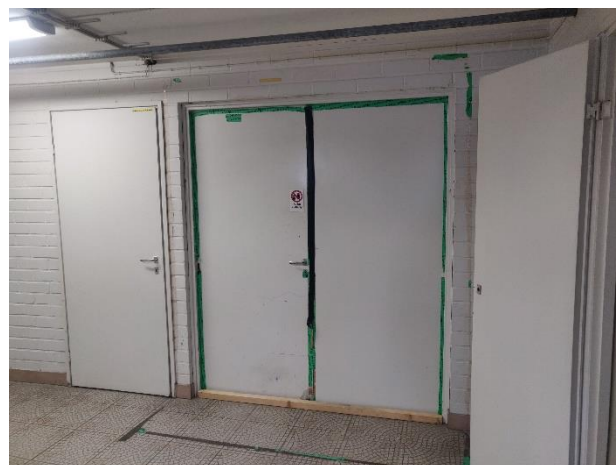
Kuva 2. Porraskäytävän PK001 välioven teippauksissa epätiiveyttä.