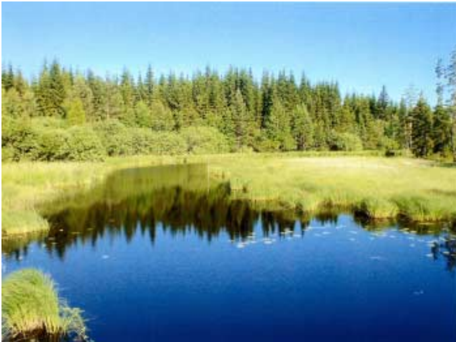
Heinäjoki kesällä 2004.

Kurjalan kylästä on matkaa Varkauteen noin 50 ja Kuopioon noin 65 kilometriä. Pinta-alaltaan Kurjalan kylä on noin 60 neliökilometriä, josta noin viidesosa on vesistöä. Kylän itäosa rajoittuu noin 20 kilometrin matkalta Suvasveteen pohjois-eteläsuunnassa. Kurjalan kylä rajoittuu pohjoisessa Puponmäen, lännessä Särkijärven ja Mustinmäen, etelässä Soinilansalmen ja idässä Haapamäen ja Näätäntaan kyliin.