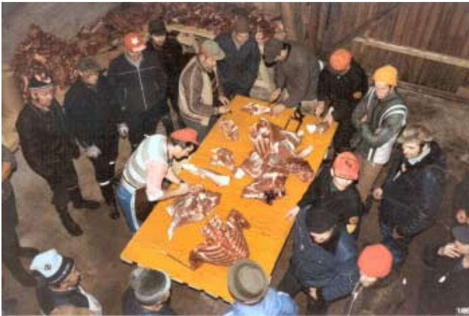
Metsästäjiä koulutettiin lihankäsittelyyn Mikkolanpellon Tynnönmäelä vuonna 1985.