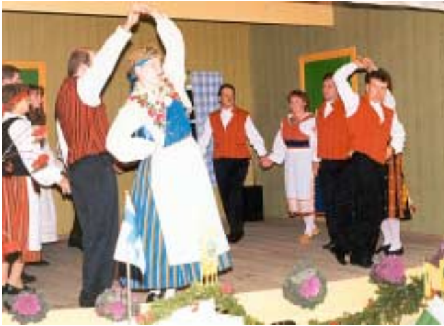
Maa- ja kotitalousseuran 75-vuotisjuhlissa tanhuttiin vuonna 1995.