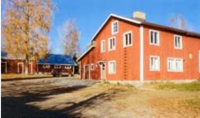
Maa- ja kotitalousseuran talo ja hirviliite-ri kesällä 2004.

pitopaikaksi. Seuralla on vuokrattava torjunta-aineruisku, kahvinkeitin, astiasto ja ruokailuvälineet. Maa- ja kotitalousseuran jäsenmäärän vähetessä teemme paljon yhteistyötä kylätoimikunnan kanssa kylän yhteisten asioiden hoidossa.